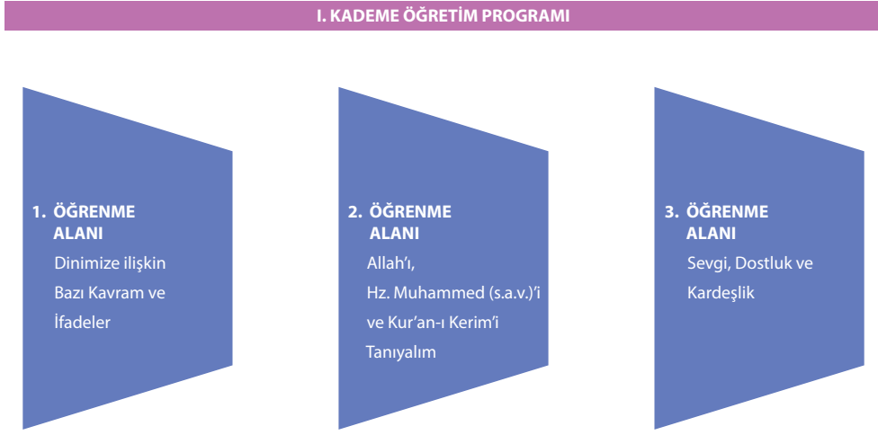
Şekil 2. I. Kademe Din Kültürü ve Ahlak Bilgisi Dersi Öğretim Programı Öğrenme Alanları

Dine ilişkin bazı kavram ve ifadeler: Bu öğrenme alanında öğrencilerin dinimize ilişkin temel kavram ve ifadeleri öğrenmesini sağlayacak besmele, şükür, dua, selamlaşma, kelime-i tevhid ve kelime-i şahadet gibi hedef ve hedef davranışların öğretimi amaçlanmaktadır.